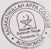
PRINCIPAL SADAKATHULLAH APPA COLLEGE Rahmath Nagar, TIRUNELVELI - 627 011.

The Audit Verification Team of Joint Directorate of Collegiate Education, Tirunelveli verified the accounts of the academic years 2018-2019 and 2019-2020 for 5 days starting from 19.06.2023 to 23.06.2023.